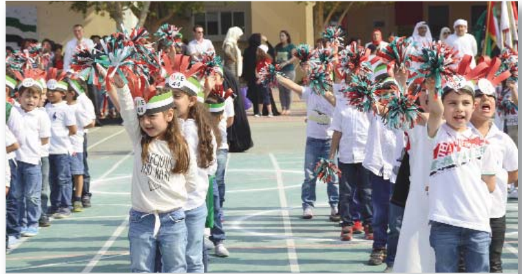
Students at Al Mawakeb School, Al Barsha