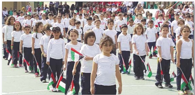
Students at Al Mawakeb School, Al Garhoud